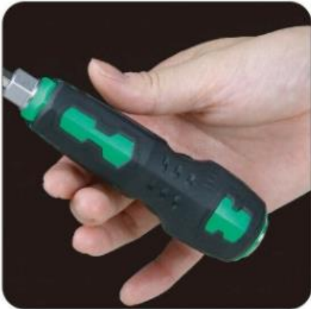
通常ドライバーより力を かけやすい薄型形状