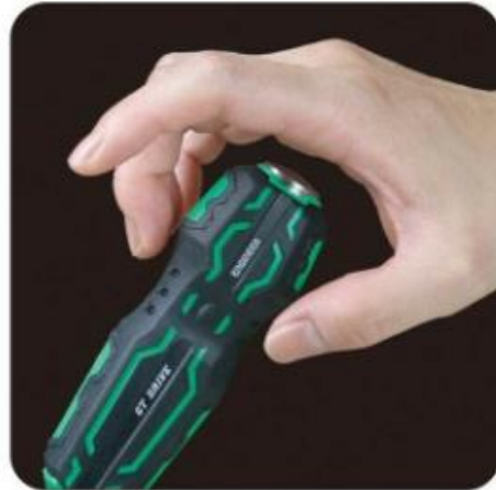
早回ししやすいくびれ部分