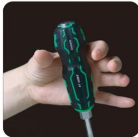
打撃面から離れた所を握る ことができるため安全