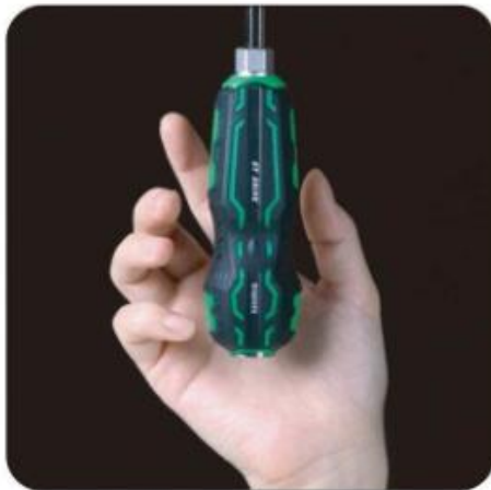
天井や壁に押し付けやすい ボールグリップ